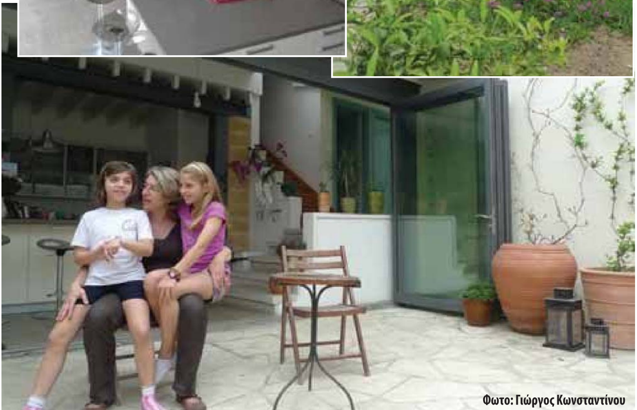
Φωτο: Γιώργος Κωνσταντίνου ➤