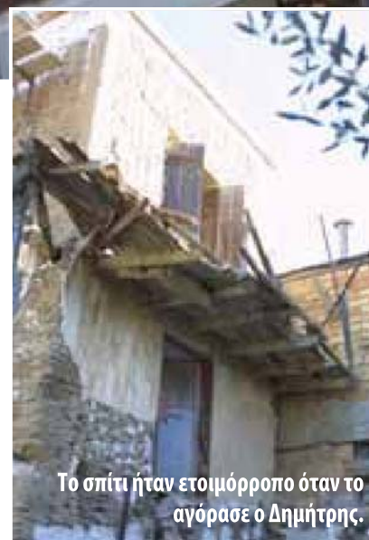
Το σπίτι ήταν ετοιμόρροπο όταν το αγόρασε ο Δημήτρης.