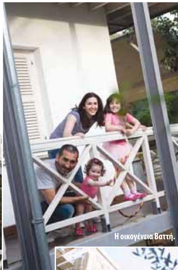
Η οικογένεια Βαττή.